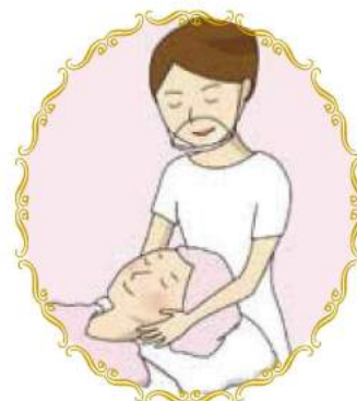
ビューティーサロンで